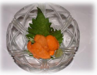
特上うに (TOKUJOU UNI) 上等海胆 ¥1,800 Premium sea urchin