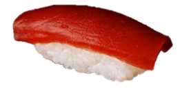
まぐろ赤身 (AKAMI) ¥242 金枪鱼瘦肉 Tuna 참치 살코기