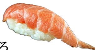
大とろ (OOTORO) ¥550 大肥金枪鱼 참치 대뱃살 Belly of tuna with a high fat content