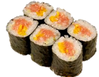
とろたく巻 (TOROTAKU) ¥660 鱼泥萝卜干卷 참치살 단무지 김초밥 Fatty tuna and Pickled Radish Rolled