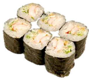
海老マヨ巻 (EBIMAYO) ¥495 熟虾蛋黄酱卷 새우마요 Mayo-dressed Shrimp Rolled