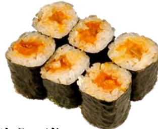
生うに巻 (NAMAUNI) ¥1,760 海胆卷 Sea Urchin Rolled