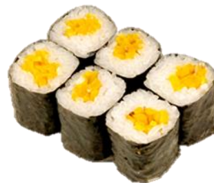
たくあん卷 (TAKUAN) ¥275 萝卜干卷 단무지 Pickled radish