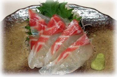
たい ¥825 (TAI) 鯛鱼 Japanese red sea bream