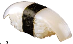
いか (IKA) ¥242 乌贼 오징어 Squid