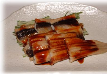
穴子 たれ・わさび (ANAGO) ¥1,045 煮星鰻 Conger eel (Tare or Wasabi)