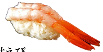
甘えび (AMAEBI) ¥286 甜虾 단새우 Orthern pink shrimp