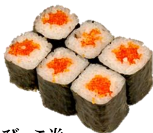
とびっこ卷 (TOBBIKO) ¥385 飞鱼子卷 Fryingfish roe