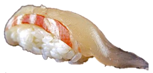
たい (TAI) ¥198 鯛鱼 도미 Japanese red sea bream