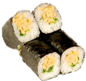
納豆卷 (NATTOU) ¥275 纳豆卷 낫토 Fermented soibean