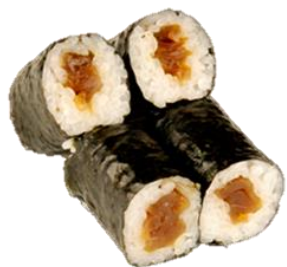
かんぴょう卷 (KANPYOU) ¥275 干瓢卷 박고지 Dried gourd strips