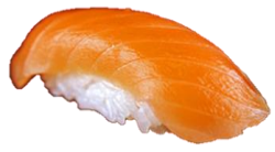
生サーモン (SA-MON) ¥242 生鲜三文鱼 연어 Salmon