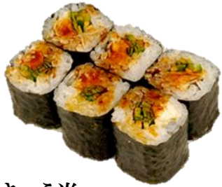
穴きゅう巻 (ANAKYU) ¥660 星鳗卷 병장어 오이 Conger eel & Cucumber