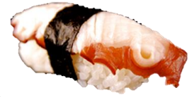
たこ (たれ・わさび) (TAKO) ¥198 煮活章鱼 삶은 문어 Boil octopus (Tare or Wasabi)