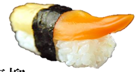
青柳 (AOYAGI) ¥286 马鹿贝 아오야나기 Chinese surf clam