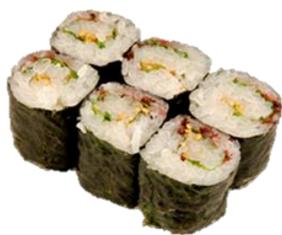
梅じそ卷 (UMEJISO) ¥275 梅酱紫苏卷 우메 시소잎 Commonly served in maki form