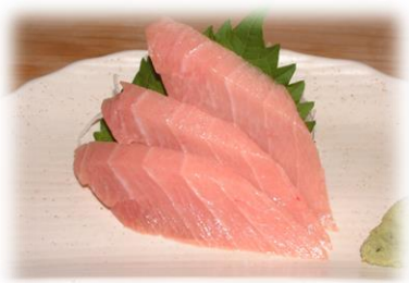
大とろ (OOTORO) 大肥金枪鱼 ¥1,650 Belly of tuna with a High fat content