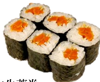
山牛蒡卷 (YAMAGOBOU) ¥275 山牛蒡卷 우엉 Picled pokeroots Rolled