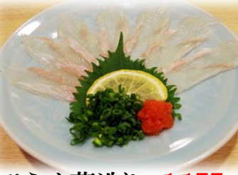
ひらめ薄造り ¥1,155 (HIRAME USUDUKURI) 比目鱼 Bastard halibut