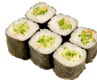
かっぱ卷 (KAPPA) ¥275 黄瓜卷 오이 Cucumber