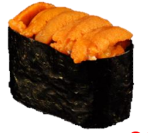
特上うに (TOKUJOU UNI) ¥990 上等海胆 특상성게 Premium sea urchin