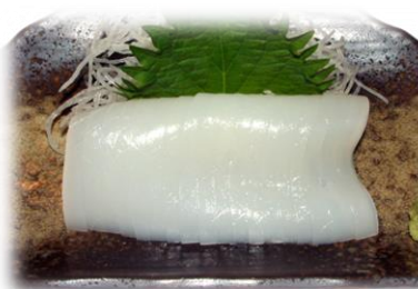
いか ¥825 (IKA) 乌贼 Squid