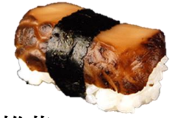
煮椎茸 (NISHIITAKE) ¥154 煮香菇 삶은 버섯 Nishiitake