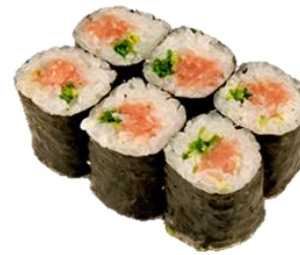
ねぎとろ巻 (NEGITORO) ¥660 金枪鱼泥卷 파 다진참치 Fatty tuna & welsh onion