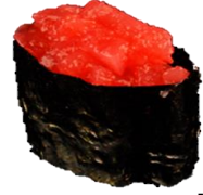
いか明太子오징어 명란 (IKAMENTAIKO) ¥198 乌贼咸明太子子 Squid & mixed pollock roe & Hot red peppers