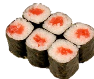
いか明太子 (IKAMENNTAIKO) ¥385 墨鱼明太子卷 Squid & mixed pollock roe & Hot red peppers