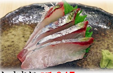
しまあじ ¥1,045 (SHIMAAJI) 大竹荚鱼 White kingfish