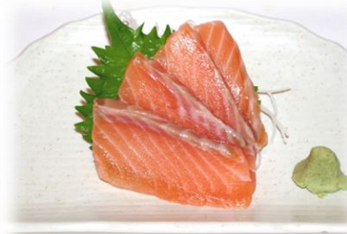
生サーモン ¥825 (SA-MON) 生鮮三文鱼 Salmon