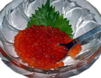
いくら (IKURA) ¥1,320 盐渍鲑鱼子 Salmon roe