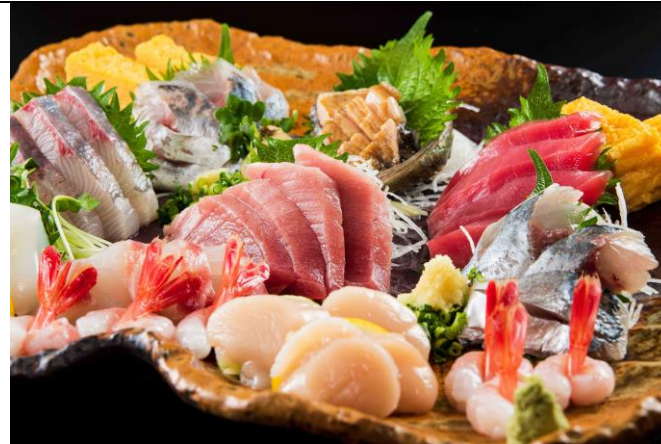
刺身盛合わせ ¥7,700 (SASHIMIMORIA WASE) 生鱼片拼盘 3~4人份 Assorted Sashimi