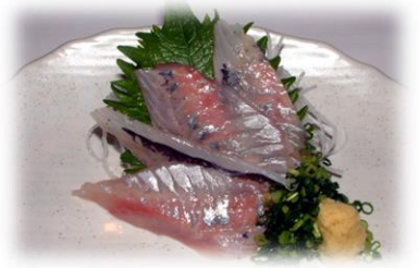
あじ ¥825 (AJI) 竹荚鱼 Japanese horse mackerel