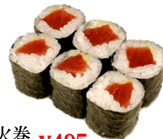
鉄火卷 ¥495 (TEKKA) 乌金枪鱼卷 참치 Southein bluefin lean tuna