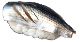
小肌 (KOHADA) ¥242 斑鯨鱼 전어 Gizzard shad