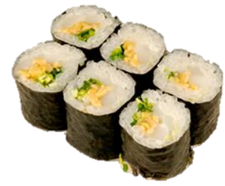
いか納豆巻 (IKANATTOU) ¥495 章鱼纳豆卷 오징어 낫토 Squid and Fermented Soybeans Rolled