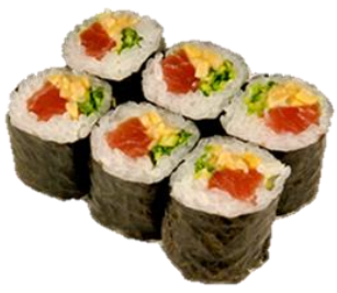
まぐろ納豆巻 (MAGURONATTOU) ¥495 金枪鱼纳豆卷 Tuna and Fermented Soybeans Rolled