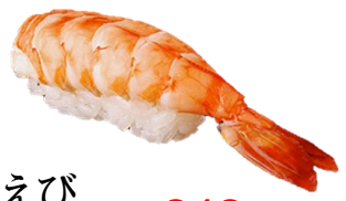
えび (EBI) ¥242 水煮大虾 새우 Shrimp