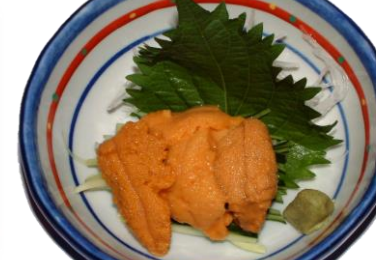
並うに (NAMI Uni) ¥1,320 海胆 Sea urchin eggs