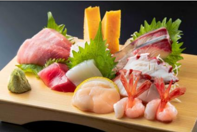
刺身盛合わせ ¥2,200 (SASHIMIMORIA WASE) 生鱼片拼盘 1人份 Assorted Sashimi