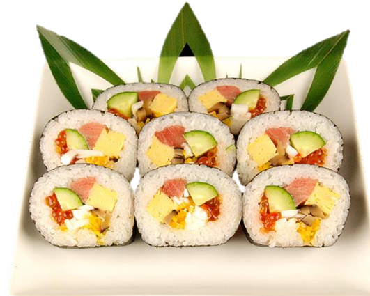
千寿司巻 (SENZUSHIMAKI) 千寿司特制海鲜卷 Senzushi Rolled