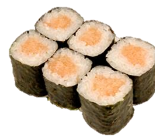
たらこ巻 (TARAKO) ¥495 鳕鱼子卷 타라코 권 Alaska Pollock Roe