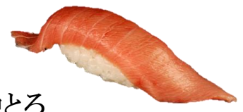
中とろ (CHUUTORO) ¥374 中肥金枪鱼 참치 뱃살 Belly of tuna with a medium fat content