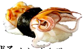
げそたれ・わさび (GESO) ¥154 乌贼腿 생 오징어 다리 Squid tentacles (Tare or Wasabi)