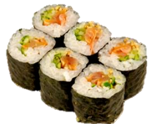
ひもきゅう巻 (HIMOKYU) ¥660 赤贝边卷 피조개쪽띠 오이 Broughton's arc shell rope & cucumber