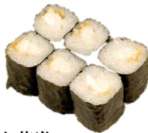
山芋卷 (YAMAIMO) ¥275 山药卷 Japanese yam