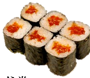
いくら巻 (IKURA) ¥1,320 三文鱼子卷 연어알 김초밥 Salmon Roe