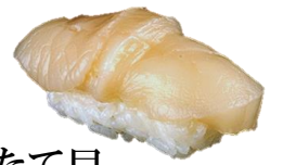
ほたて貝 (HOTATEGAI) ¥286 扇贝 가리비 Scallop