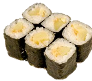
数の子巻 (KAZUNOKO) ¥660 青花鱼子卷 수의 자권 Herring Roe