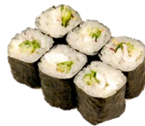
げそマヨ卷 (GESOMAYO) ¥385 章鱼蛋黄酱墨卷 Squid tentacles & mayonnaise