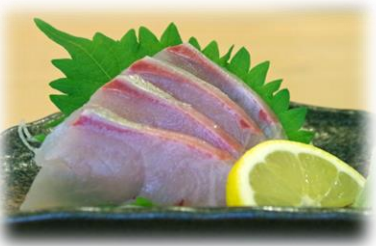
かんぱち ¥825 (KANPACHI) 高体鰺 Great amberjack