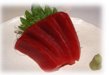
まぐろ赤身 (AKAMI) 金枪鱼瘦肉 ¥825 Tuna