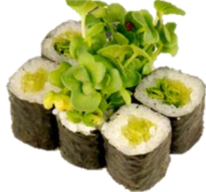
貝割れ大根卷 (KAIWAREDAIKON) ¥275 萝卜芽卷 말린 무 Kaiware radish