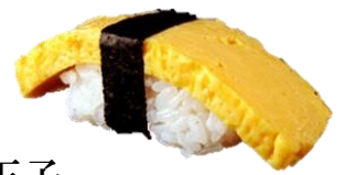
玉子 (TAMAGO) ¥154 鸡蛋 달걀 Seasoned omlett