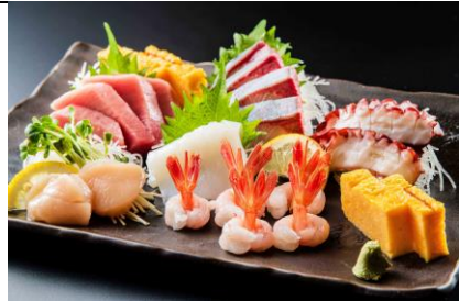
刺身盛合わせ ¥4,400 (SASHIMIMORIA WASE) 生鱼片拼盘 2人份 Assorted Sashimi