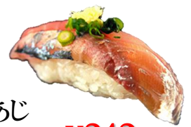
あじ (AJI) ¥242 竹荚鱼 전갱이 Japanese horse mackerel