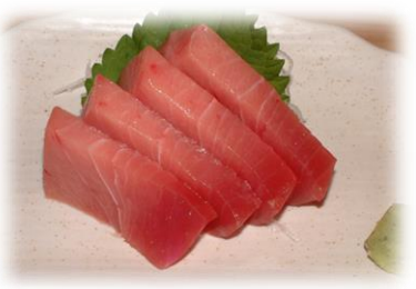
中とろ (CHUUTORO) 中肥金枪鱼 ¥1,320 Belly of tuna with a medium fat content