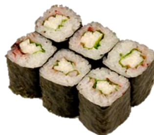
梅じそ山芋 (UMEJISOYAMAIMO) ¥275 梅酱紫苏山芋卷 Ume Perilla and Yam Rolled